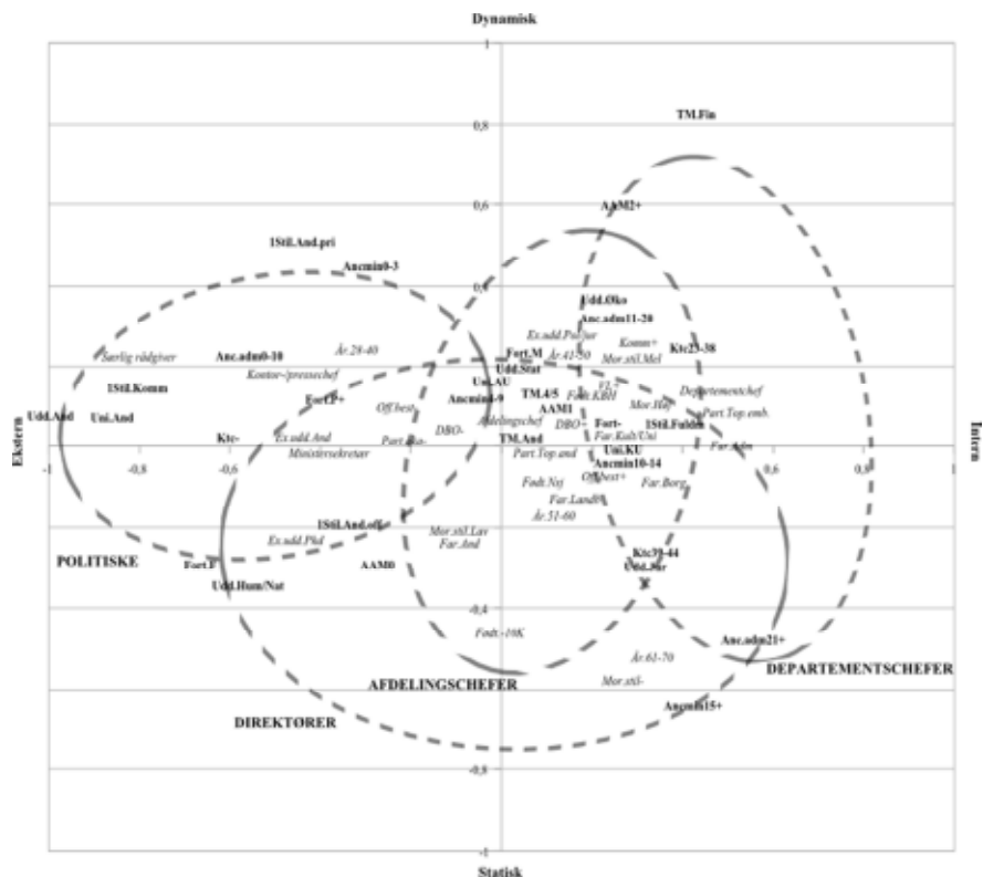
Figur 1. Rummet for topembedsmænd

Note: Aktive (fed) og udvalgte passive (kursiv) modaliteter samt koncentrationsellipser for departementschefer, afdelingschefer, direktører og diverse politisk rådgivende stillinger (kontor-/pressechefer, ministersekretærer og særlige rådgivere).