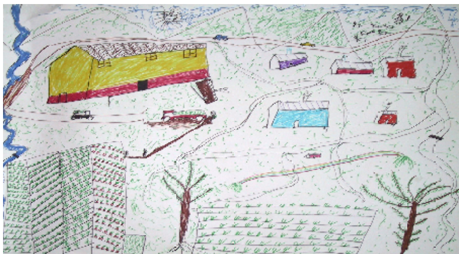
Figur 1: En tegning fra Cunya

For at give et indtryk af tegningerne kan det være nyttigt at præsentere nogle eksempler.