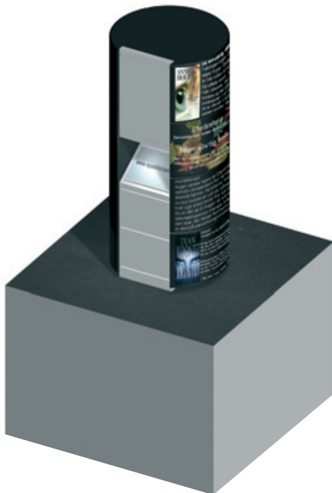
3. PRÆMIEN - med bogsøjler på banegården bliver det mere meningsfyldt at vente