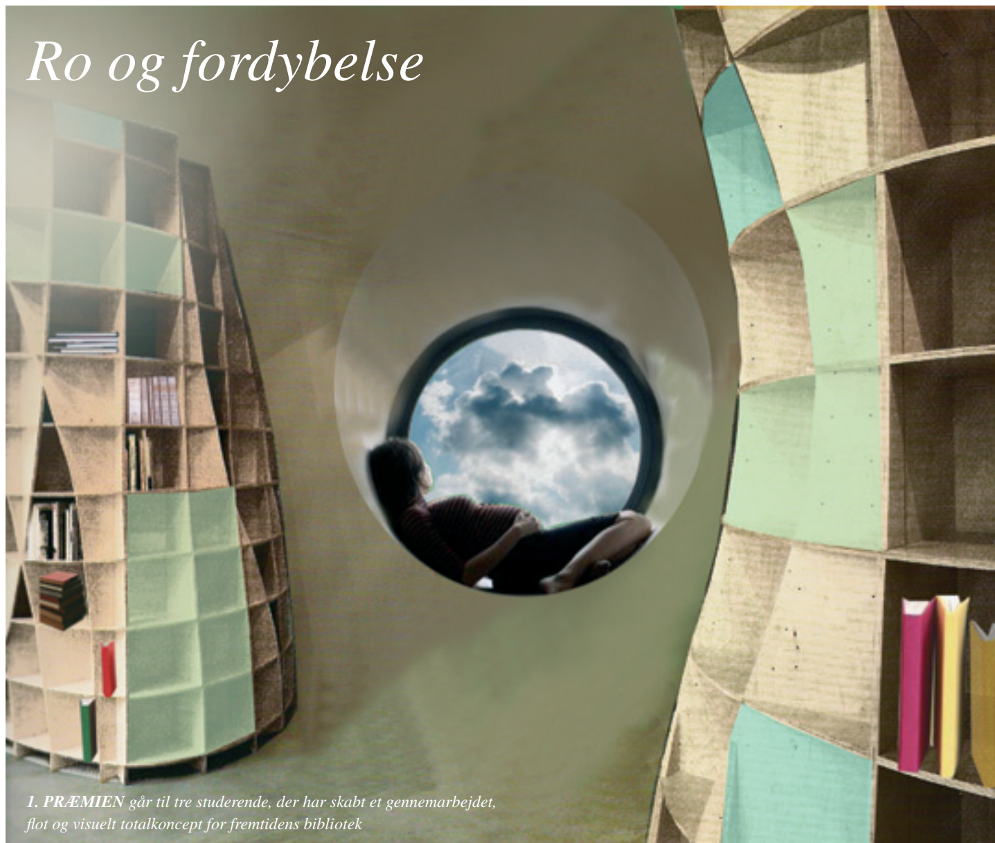
1. PRÆMIEN går til tre studerende, der har skabt et gennearbejdet, flot og visuelt totalkoncept for fremtidens bibliotek

KASB havde sat sig selv på dagsordenen i hele efteråret 2005 på Arkitektskolen ved mange forskellige aktiviteter. Forelæsninger, jubilæumshjemmeside, afsløring af kunstværket 'Månens Kvadratur' og reception.