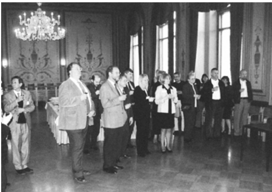
Rådhusreception i Kuopio.