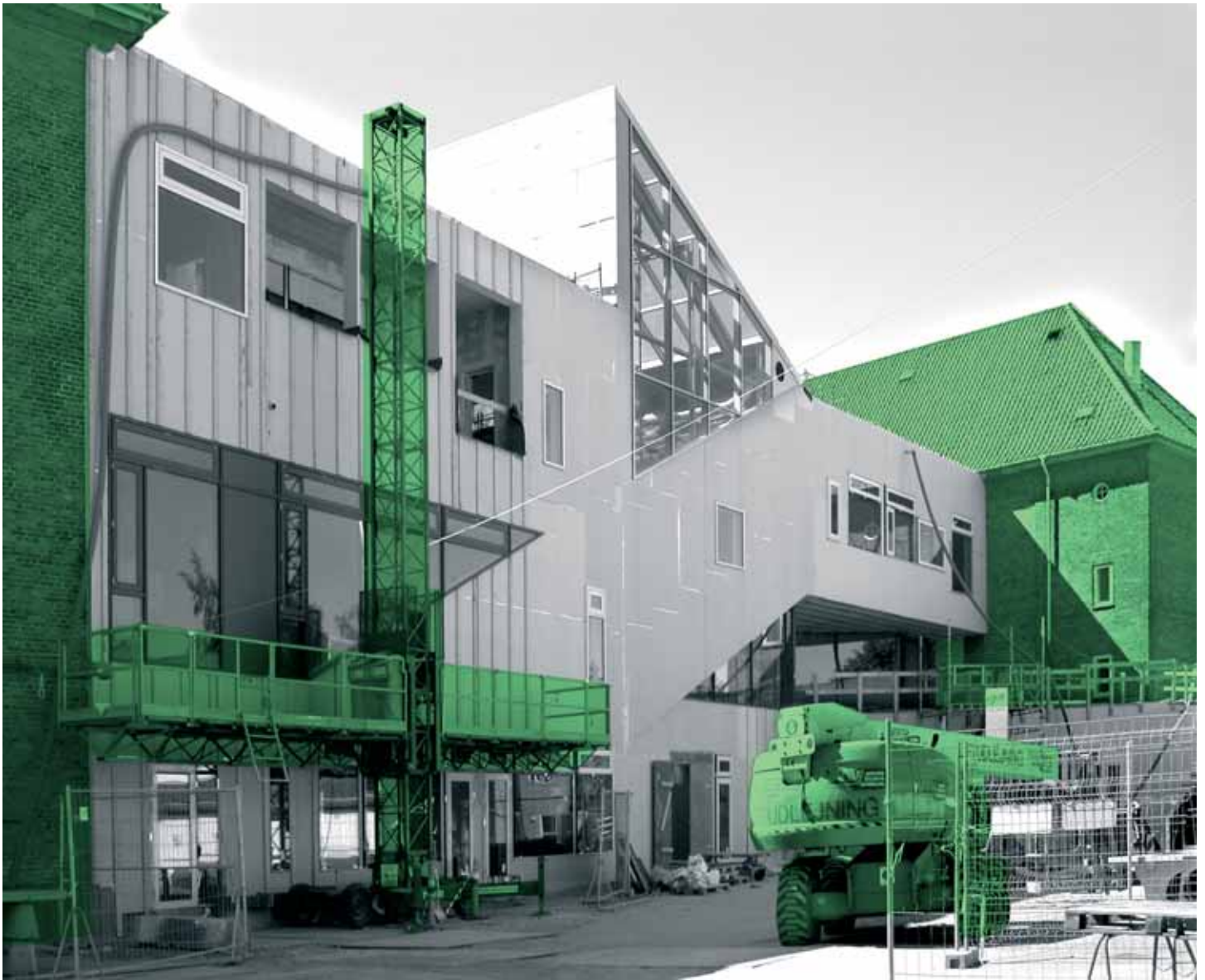
Case 2: Ordrup facade