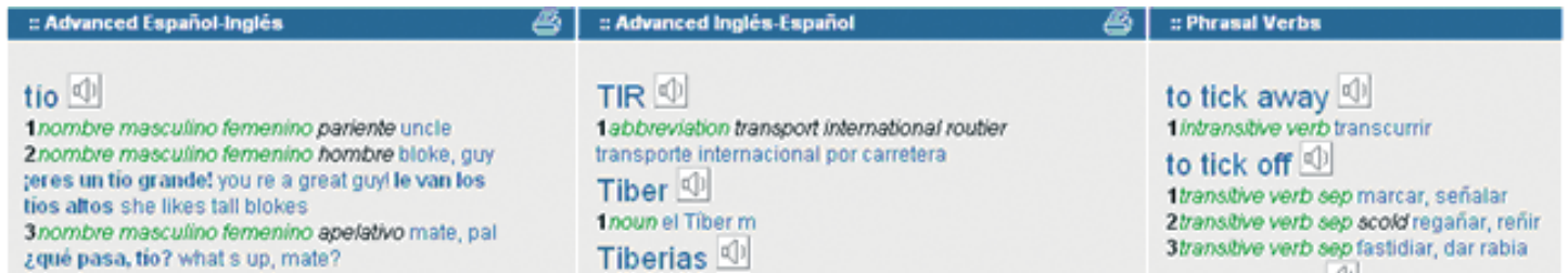
Fig. 3. Opslag på det spanske ord tio (onkel) giver en par kryptiske opslag i de to ordbøger, som har engelsk som kildeprog.

mere gennemgribende struktur op fra bunden. I Diccionarios.com har man i stedet valgt den lette automatiserede løsning, som linker praktisk talt alle ord og som stiller meget store krav til brugerens evne til at gennemskue resultatet.