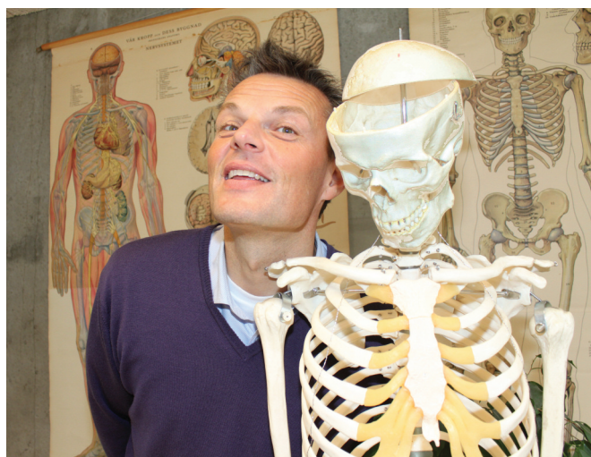
INTERVIEW & FOTO: REVY