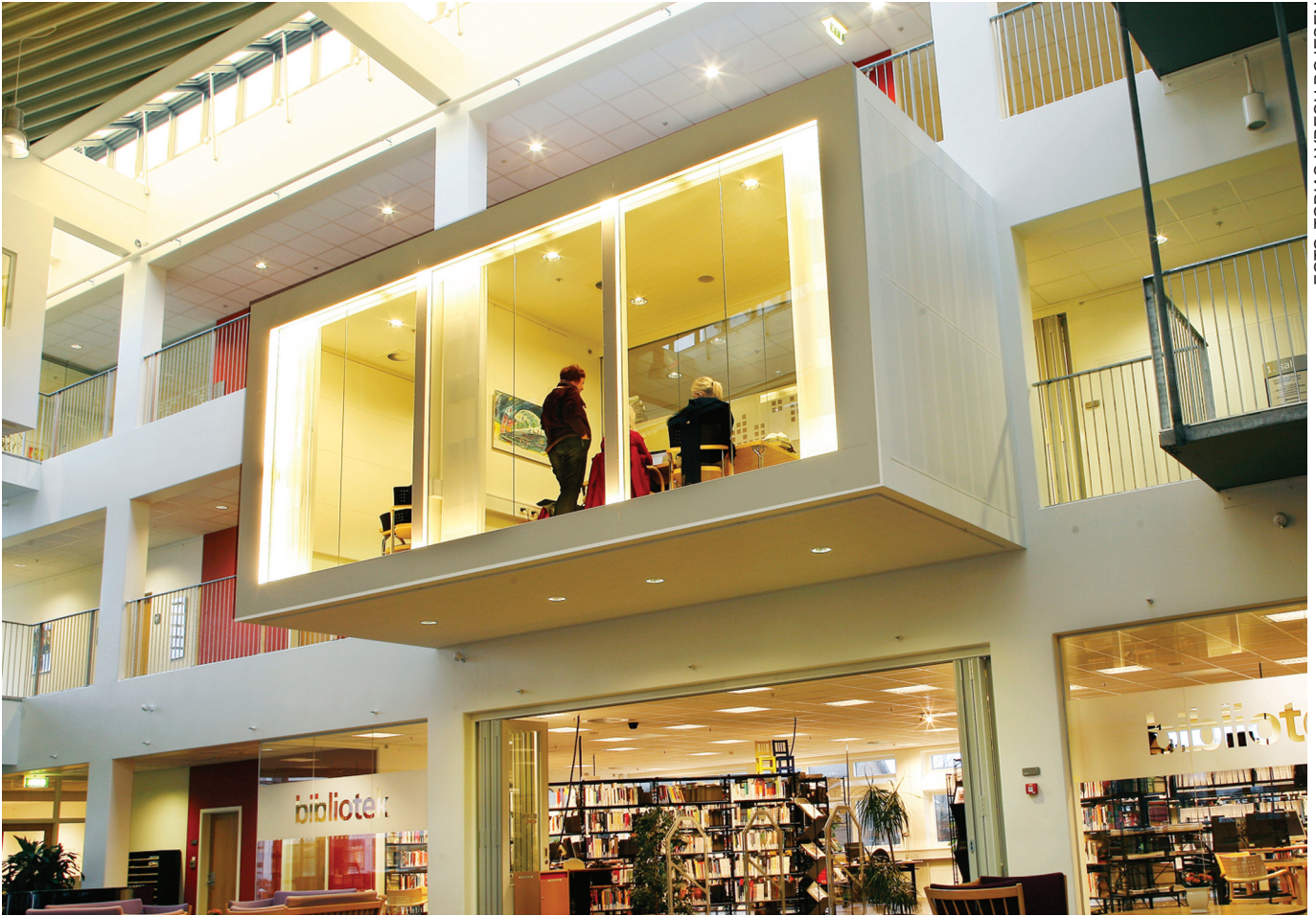
VIA bibliotekerne, Holstebro Campus

Disse fællesskaber har på det seneste manifesteret sig med nogle meget markante resultater, eksempelvis: