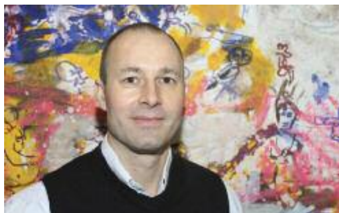
INTERVIEW & FOTO: REVY