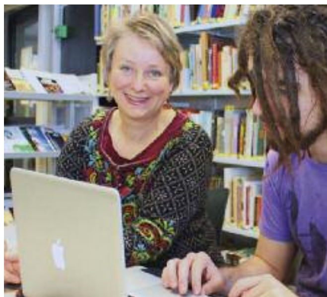
INTERVIEW & FOTO: REVY