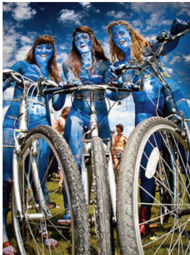
Internationale studerende cykler og laver studiebase, hvor cykelforholdene er bedst.

Brugerkaravanen har anvist konkrete tilgange og metoder, som fremadrettet vil sætte biblioteker i stand til at se deres brugere i et nyt lys. At anskue brugeren som et helt menneske med behov, som ikke er skarpt adskilte, men i virkeligheden indbyrdes rela-