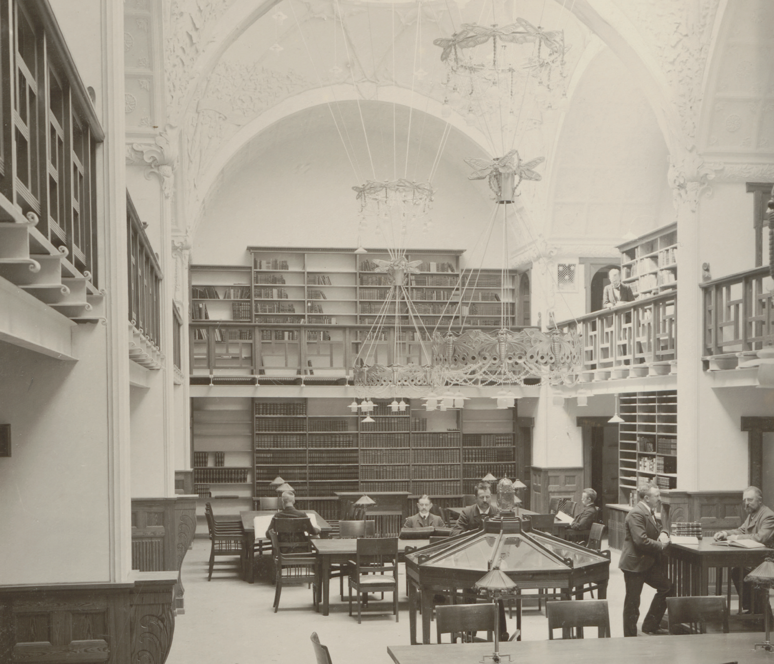
Statsbibliotekets første bygning i Århus