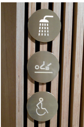
Brusekabine og skifterum hører også til i en holistisk tankegang.