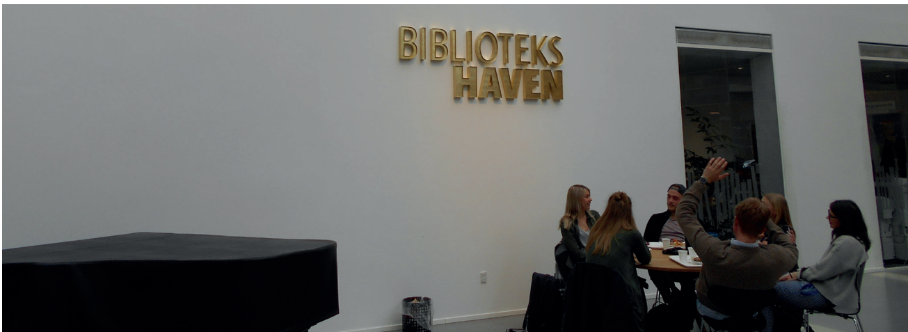
Træd indenfor. Det nye studiemiljø "Bibliotekshaven" åbnede i februar 2018.