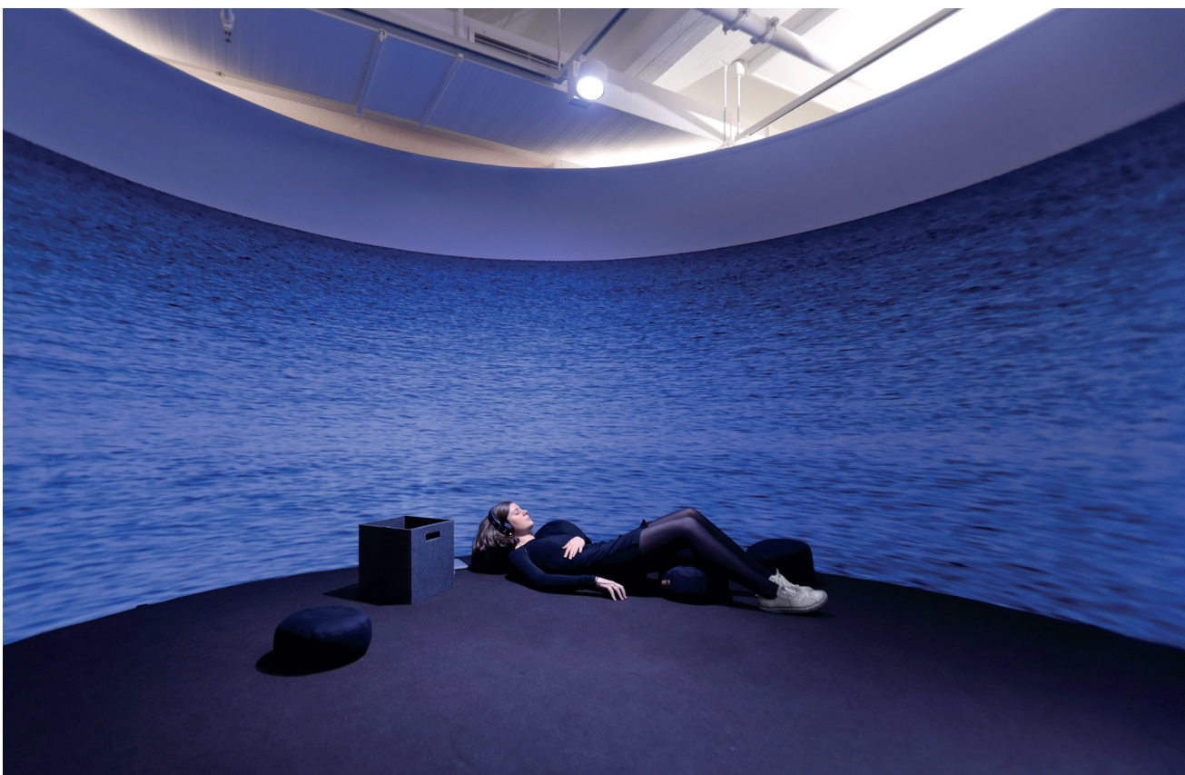
Mindfulness i kælderen. Tid til en tænkepause.