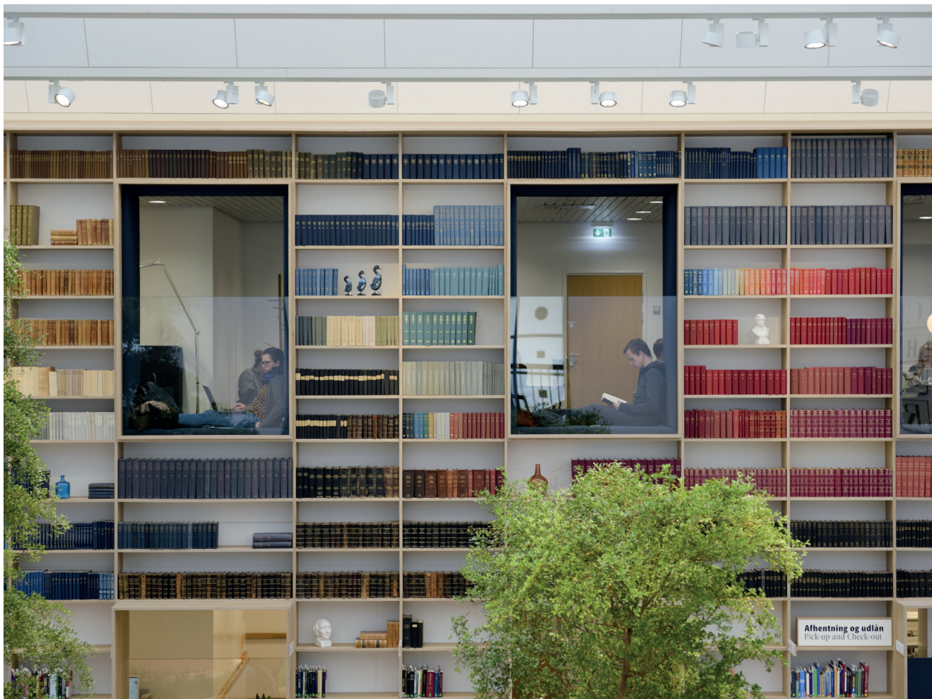
Wall of Materials. I stueplan er der ventehylder.