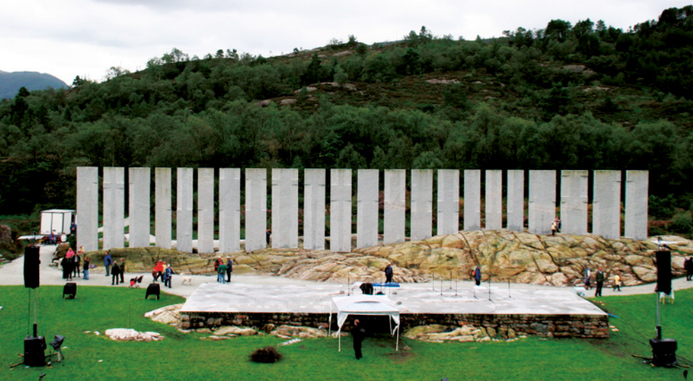
Tusenårsstaden Gulatinget er en park oppført til minne om Gulatinget. Det ligger i Flolid, ca. 4 km fra kommunehuset.

sammen, slik at skjermt tekstene vises dobbelt. På veggen henger en tavle nesten som en papir-collage av utskrifter, et postkort, samt håndskrevne gule og røde post-it-lapper. Hopland kobler den blå eksterne harddisken med filene til laptopen, og de flere hundre år gamle pergamentsidene, i norrønt språk, lastes deretter sakte opp på skjermen. Jeg tenker på det jeg har lest, nemlig at ett eller flere blad er skåret eller revet ut. Hvem gjorde det? Hvilken informasjon ble fjernet? Det merkes kanskje ikke i den digitale versjonen? Filene er høyoppløselige, slik at en kan blåse opp hver enkelt side og se hvordan skriveren eller skriverne har tegnet inn svake hjelpelinjer for å få teksten rett. Hopland forstørrer opp et håndskrevet sidetall øverst til venstre.