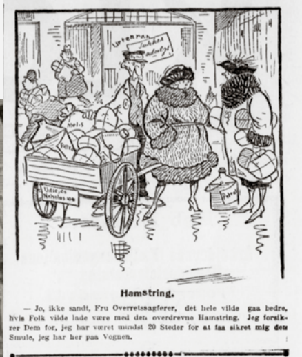
Hamstring - også i 1922. Fra avisen "Klokken 5", 24. februar 1922.