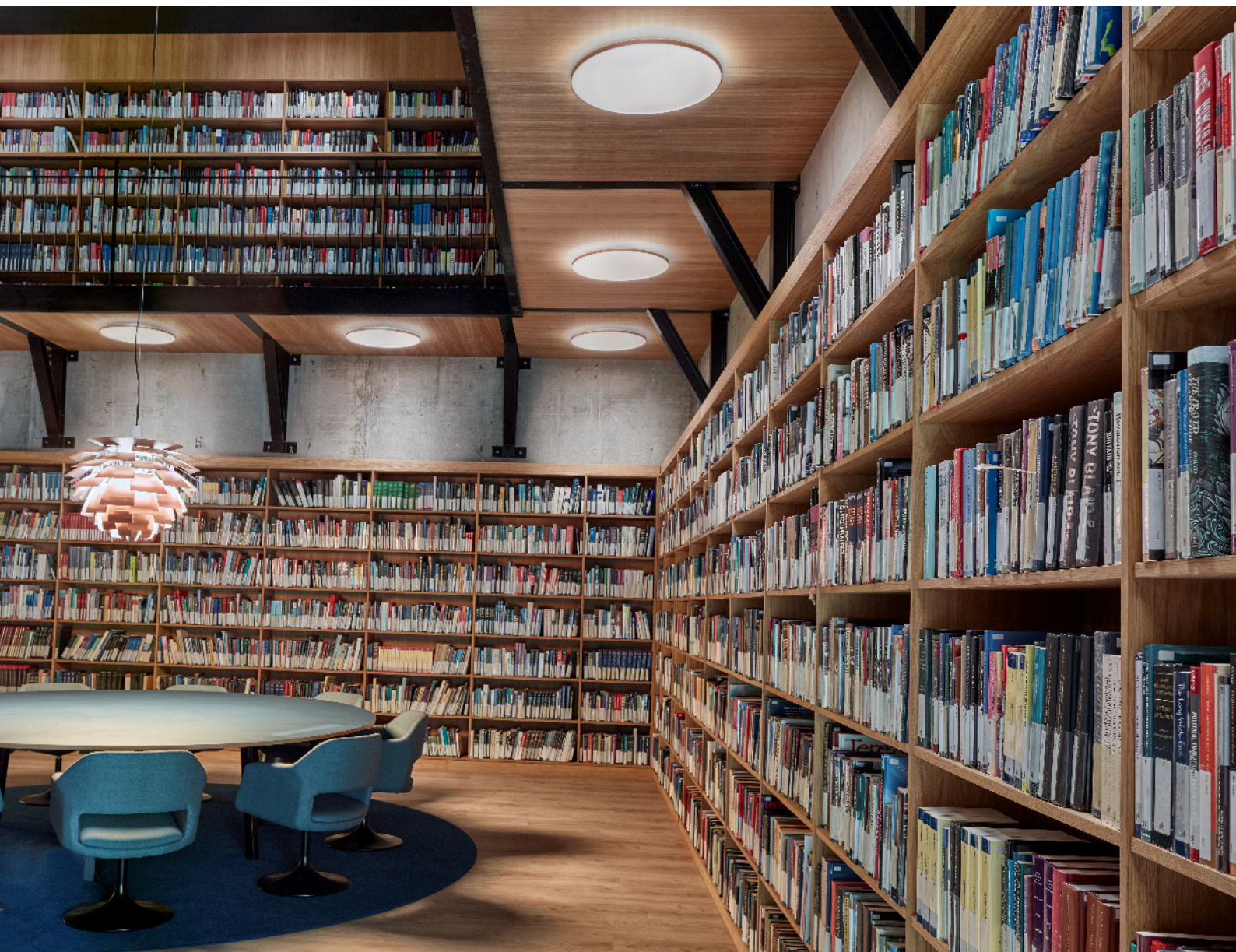
Træ, lys og bøger. Mindre læsesal til studerende, der gerne vil sidde i ro.