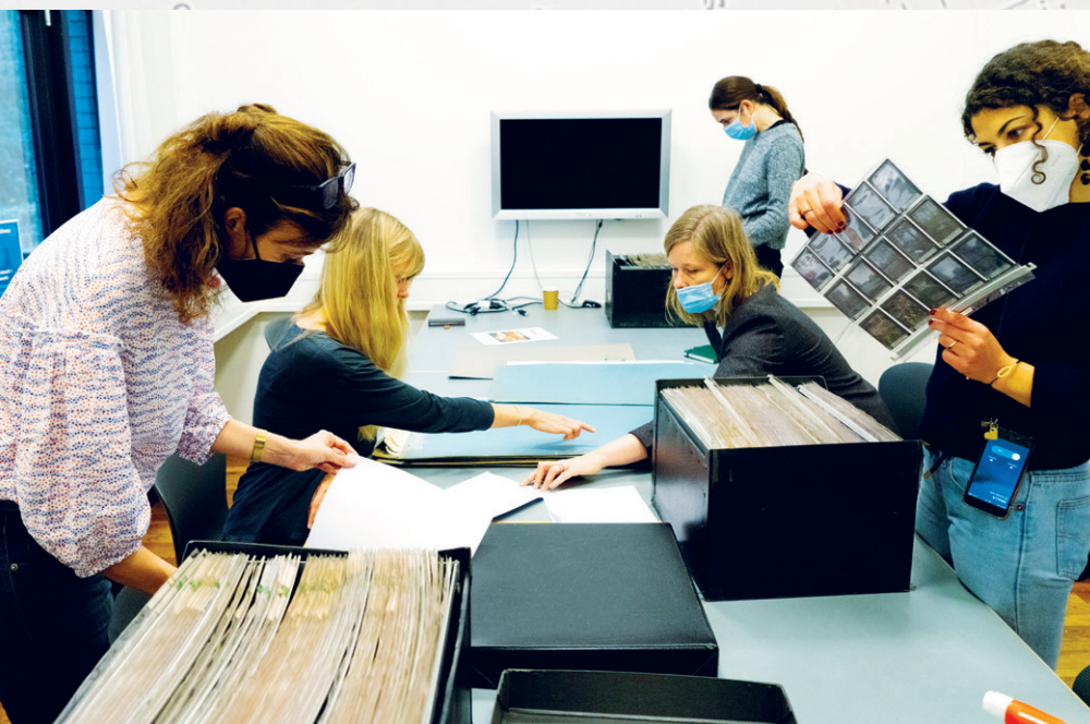
Landskabsarkitektstuderende undersøger arkivmateriale.

Der er flere forklaringer på dette. Det var almindeligt, at kvinder stoppede med at arbejde, når de blev gift. Nogle af dem giftede sig med en kollega og fortsatte deres arbejde på mandens tegnestue, måske under hans navn. Andre igen tegnede på tegnestuer for og med deres mandlige kolleger, og mange af dem arbejdede i højere grad med en anden type projekter end de