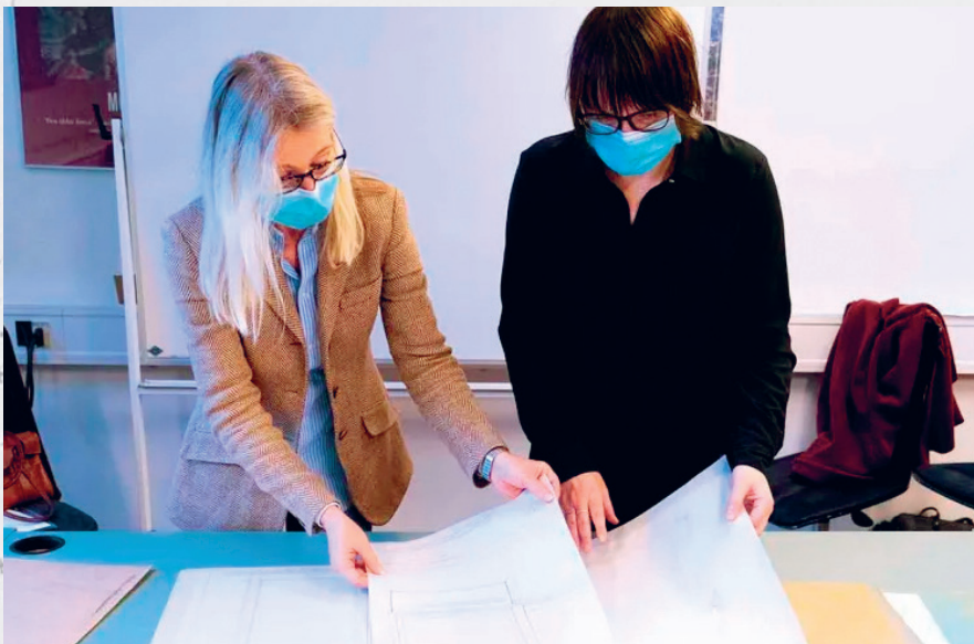
Landskabsarkitektstuderende undersøger arkivmateriale.

store prestigegivende værker, der har fået anerkendelse i eftertiden.