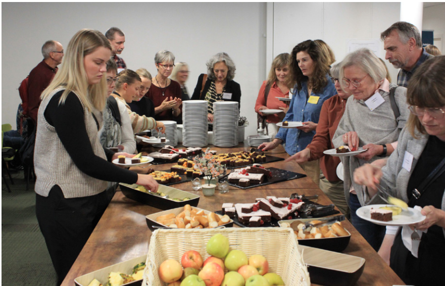
Kaffe-kagebordet var velbesøgt i eftermiddagspausen.

så det kan godt blive lidt rovdrift, hvis man holder årsmøde i denne form for tit. Men det er meget længe siden, vi er blevet påskønnet så meget for vores arbejde som nu,” siger hun.