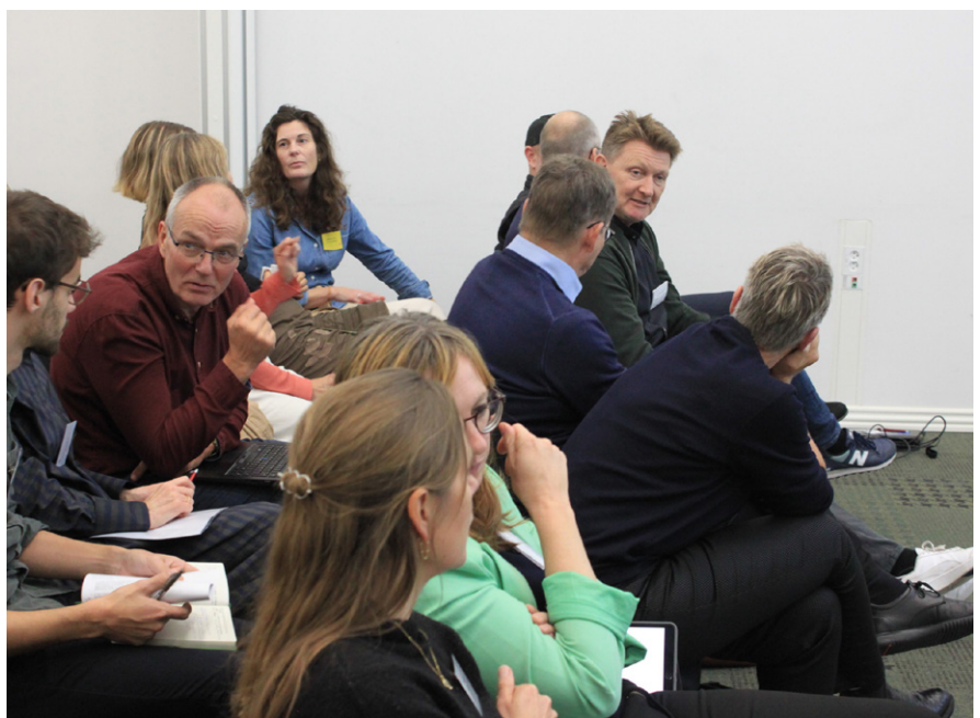
Der blev summeret på rækkerne til et oplæg om markedsføring af klimaindsatsen på Det Kgl. Bibliotek.

”Selvom det blev sent for nogen i går, så er der alligevel folk, der snakker. Det summer. Selvfølgelig er folk trætte, men på den gode måde.”