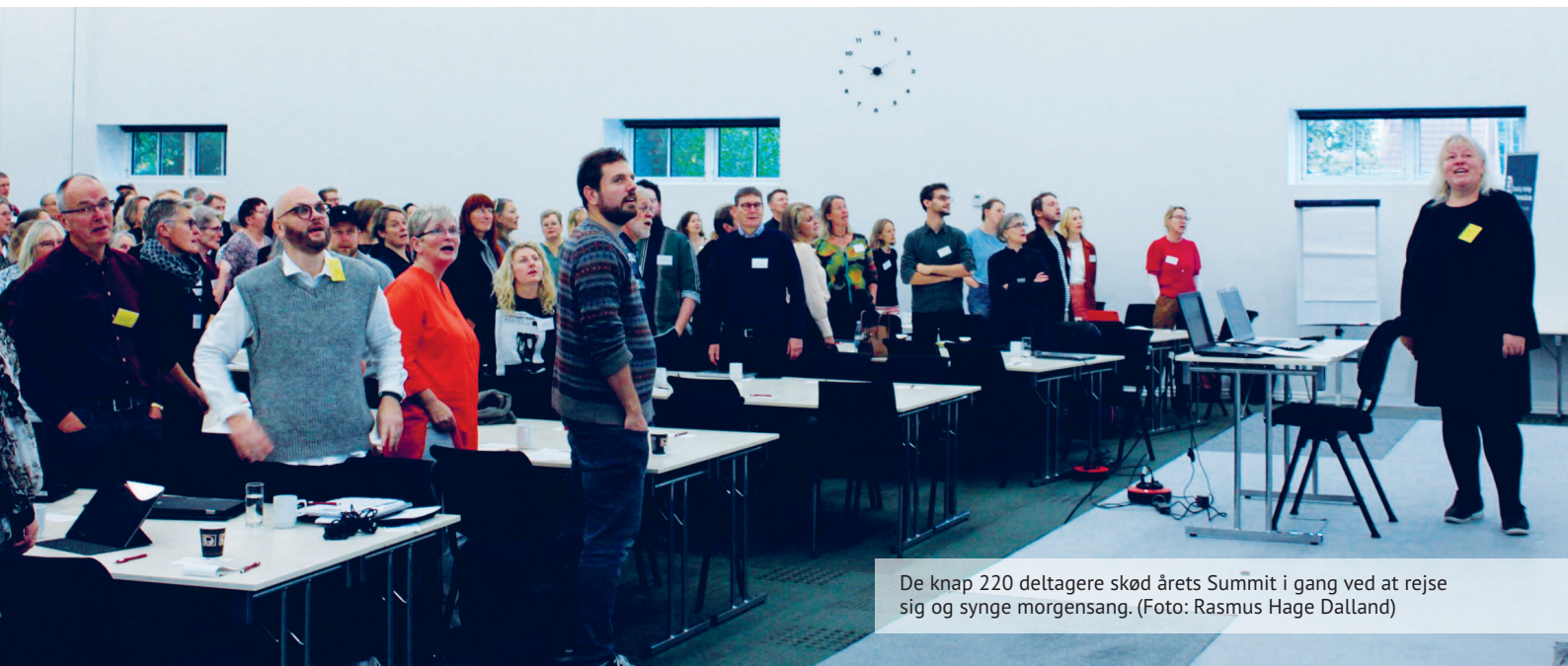
De knap 220 deltagere skød årets Summit i gang ved at rejse sig og synge morgensang.