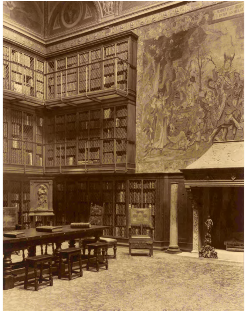
↑ J.P. Morgans bibliotek, det såkaldte East Room, mellem 1923 og 1935.

“ Greene var i sin tid opsat på at gøre The Morgan Library and Museum til en af de førende institutioner i verden, og hun sagde til J.P. Morgan, at hun drømte om at trumfe både British Museum og Frankrigs Bibliothèque Nationale.