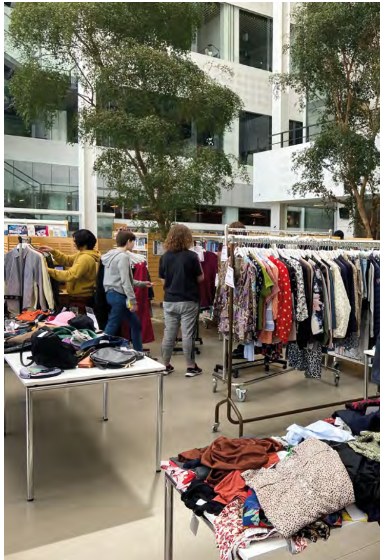
↑ Pop-up genbrugsbutik på biblioteket i Sønderborg i samarbejde med Røde Kors.

I 2019 meldte SDU ud, at FN's 17 Verdensmål skulle indarbejdes som en integreret del af universitetets virke. Allerede nogle måneder forinden havde Bertil Dorch nedsat bibliotekets eget bæredygtighedsudvalg. Om end verdensmålene ikke længere er eksplicit formuleret i universitets strategi, er bæredygtighed fortsat integreret i universitetets strategiske indsats, og arbejdet med især klimaplan og klimamål er indlejret i organisationen.