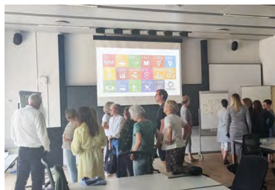
↑ Juni 2023: Personaledag i bæredygtighedens tegn, her workshop.