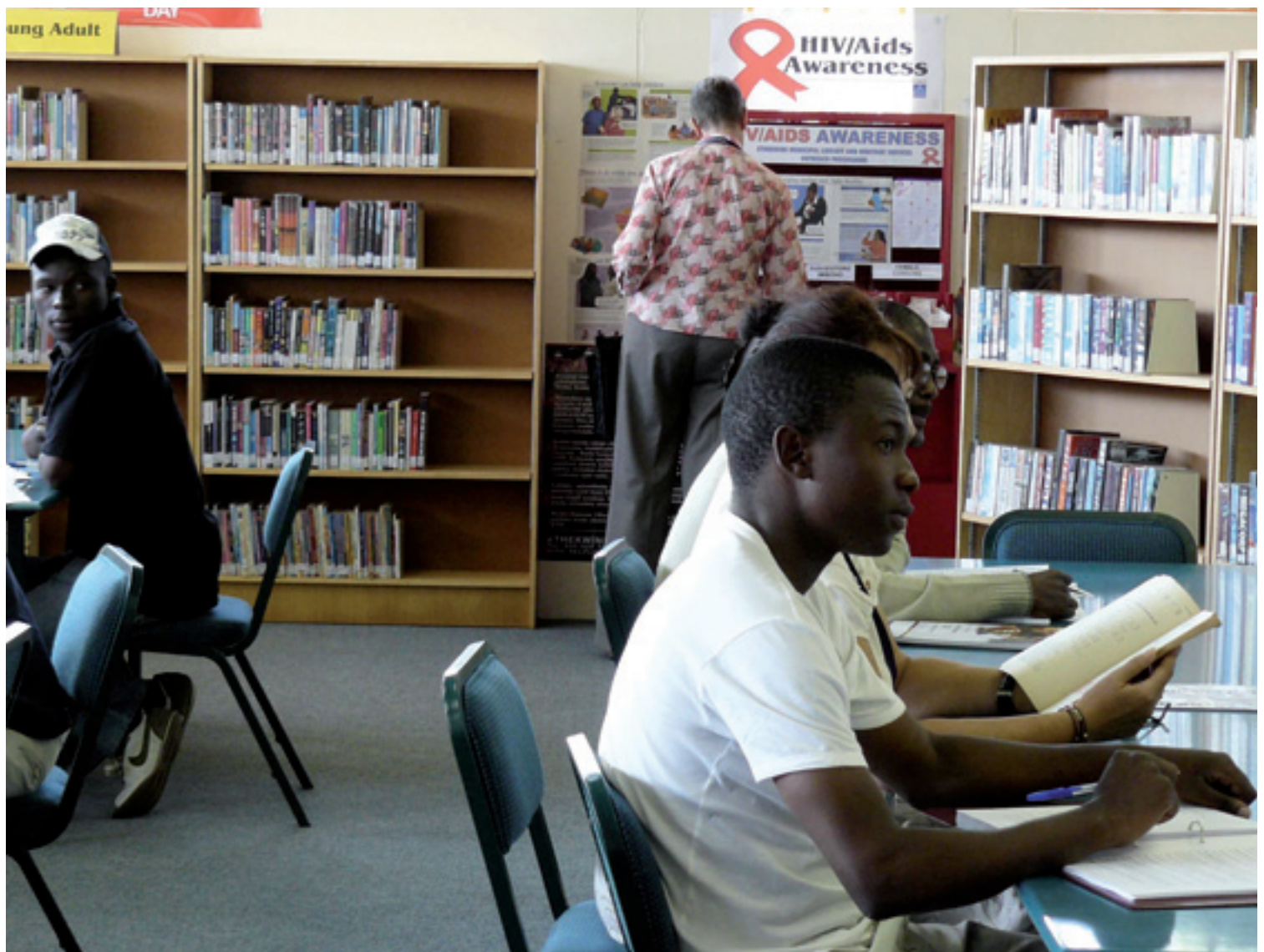
Biblioteket var velforsynet og velorganiseret med alle medier til rådighed – samt et hjørne, med kondomer og afskrækkende billeder og udsagn fra døende HIV/AIDS-ofre.

færdes i biblioteket og viste hensyn til hinanden i køerne ved skranken!